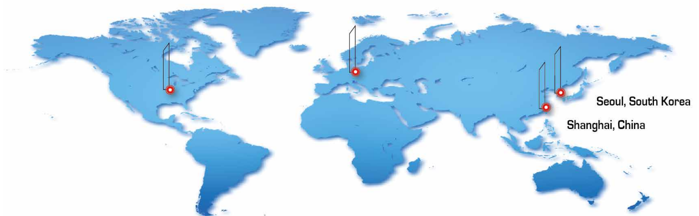
Šumperk, Czech Republic