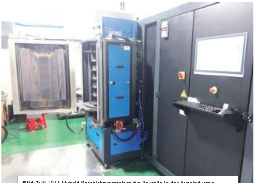
Bild 7: PL101 I-Hybrid Beschichtungsanlage für Bauteile in der Autoindustrie Anwender: Füllandi, Shenzhen, China.