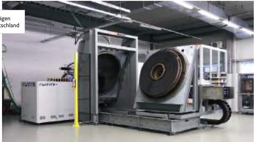
Bild 2: \pi 603 Beschichtungsanlage für Bandsägen Anwender: Wikus, Spangenberg, Deutschland

Der Abstandhalter verhindert, dass die Wicklungen des Coils aufeinander liegen und ermöglichen, dass Seitenflächen des Bandes (zumindest zum Teil) auch mitbeschichtet werden.