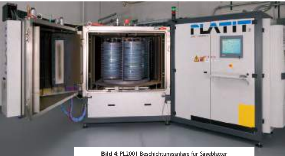
Bild 4: PL2001 Beschichtungsanlage für Sägeblätter Anwender: TRU-CUT, Brunswick, Ohio, USA.

verteilung in der «Tiefe» des Sägeblattes (Bild 5). Es ist nur bei HSS-Sägeblättern wichtig. Sie werden üblicherweise nur nachgeschliffen und nicht nachbeschichtet. Nach dem Nachschliff bleibt nur die Schicht an den Seitenflächen des Sägeblattes übrig, die zur Leistungssteigerung nur ein wenig beitragen kann. Eine Nachbeschichtung würde die Leistung bedeutend erhöhen, aber es wird heute leider nicht praktiziert. (Aus welchen Gründen auch immer...)