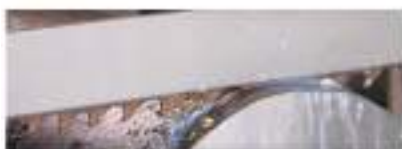
Bild 3: Entwicklung von Dedicated Schichten zum Sägen im rostfreien, austenitischen Stahl. Werkstückmaterial: X6CrNiMoTi17-12-2 – 1.4571 D-Werkstück: 300 mm.