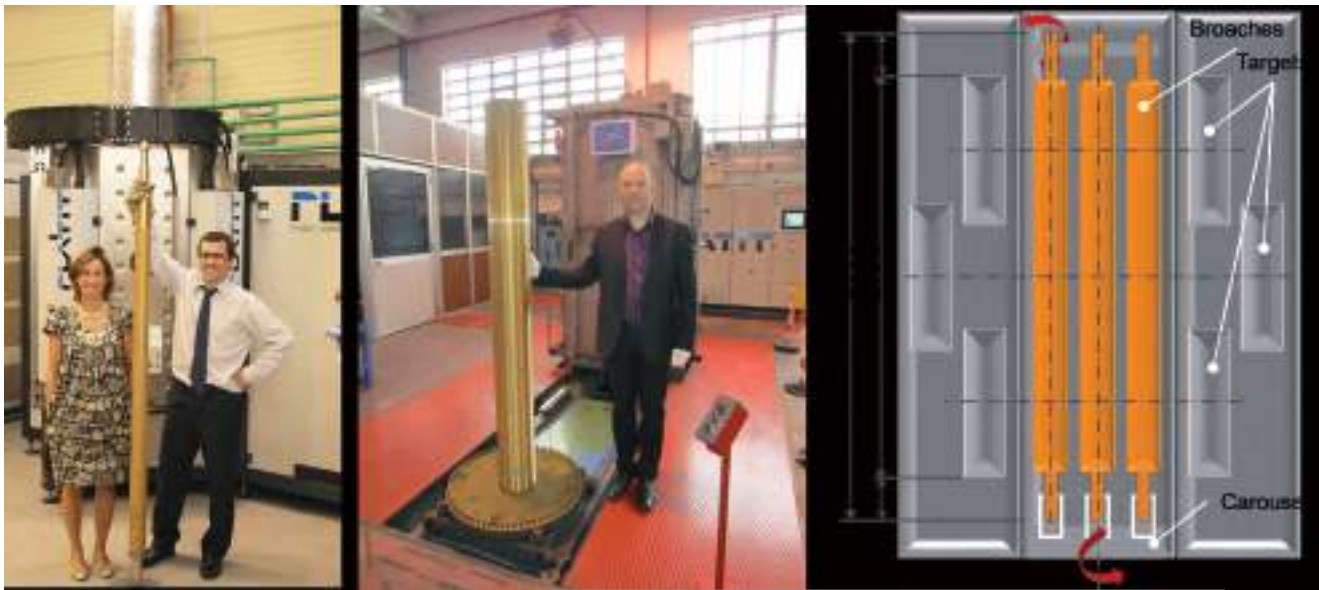
Bild 6: Beschichtungsanlagen für Räumnadeln A; PL1400 mit «Hut» bei Metalestalki, Bilbao, Spanien B; PL2500 bei Genta, Torino, Italien C; PL2511 Projekt mit 6 Kathoden.

Nach der Abscheidung der Haftschrift werden die Shutters der Kathoden geschlossen und mittels des PECVD-Verfahrens (Plasma Enhanced Chemical Vapor Deposition) eine DLC-Schicht (Diamond Like Coating) gebildet. Die DLC-Schicht wird als siliziumgedopteter ((dotierter) amorpher Kohlenstoff mit Wasserstoff gebildet; a-C:H:Si.